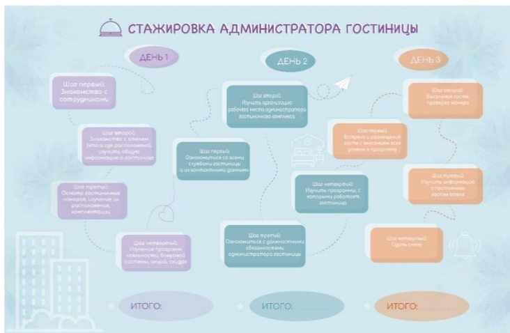
Рисунок 1. Игровое поле для стажировки новых сотрудников на должность администратора По результатам оценки экономической эффективности предложенных

В качестве применения технологии геймификации в гостиничном предприятии было предложено внедрить лидерборд и игровое поле (рис. 1).