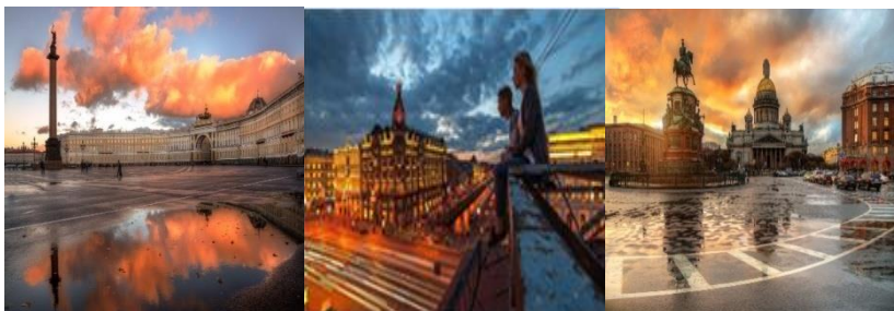
Рисунок 1 – Достопримечательности Санкт-Петербурга

Стоимость тура на одного человека составляет 45 518 рублей.